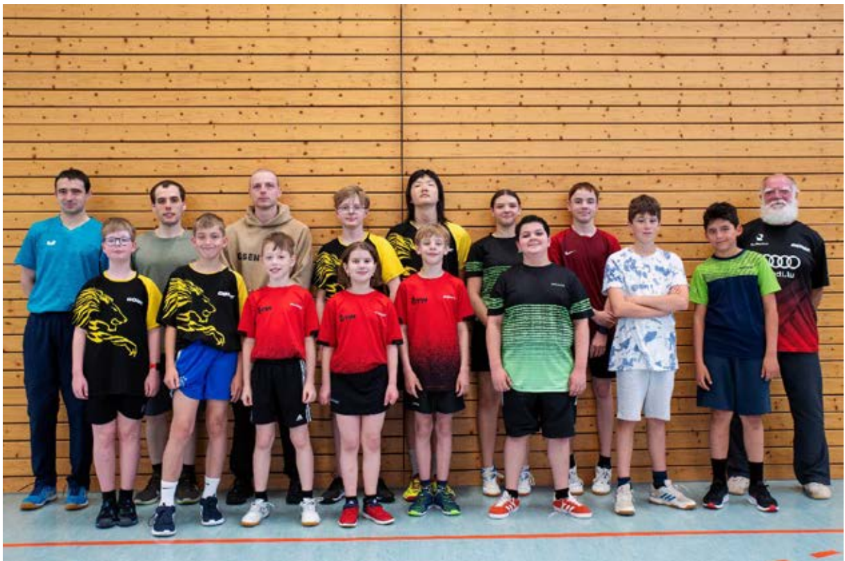
Photo des Regionallehrgangs Norden in Wilwerwiltz im Mai 2024